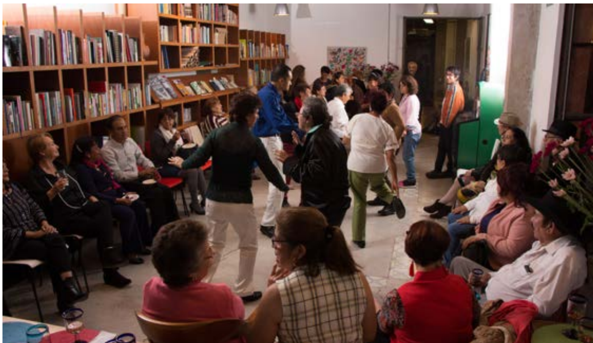
Baile de verano para vecinos adultos mayores.