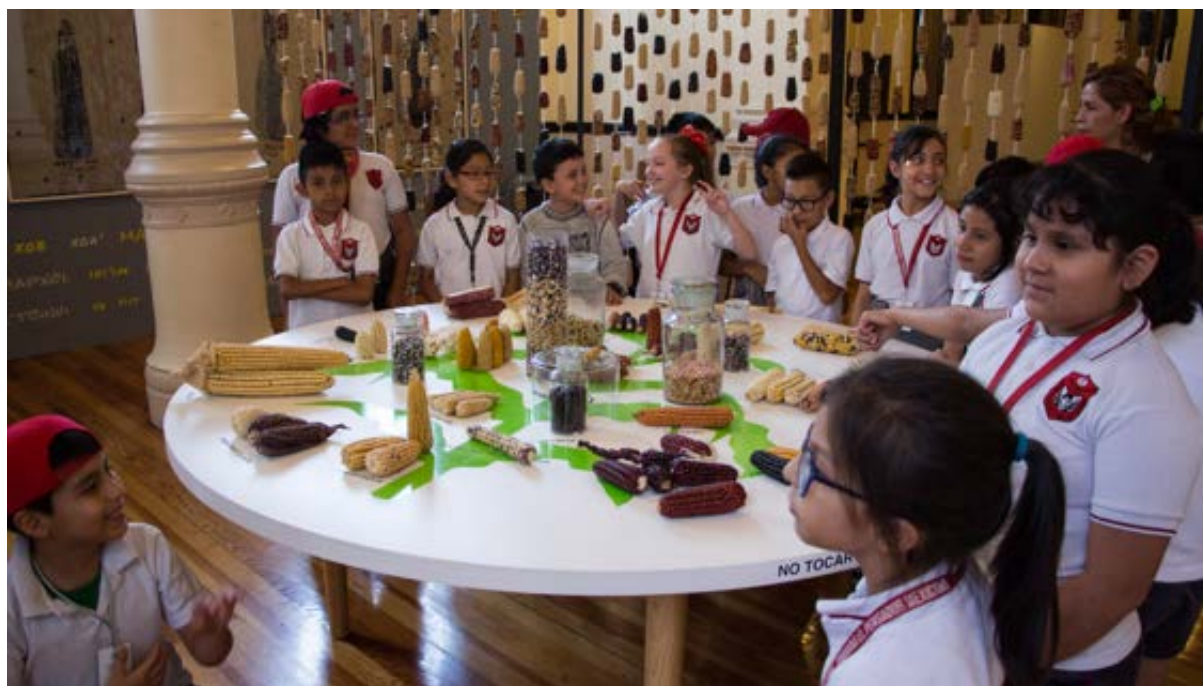
Visita escolar a la muestra Maíces, biodiversidad y cultura . Una aproximación desde su consumo cotidiano en el Museo de Geología.

Durante el verano se realizaron las últimas actividades didácticas antes de la conclusión del periodo de exhibición de Maíces, biodiversidad y cultura. Una aproximación desde su consumo cotidiano en el Museo de Geología. En total asistieron 8,400 visitantes durante los horarios regulares del museo y más de 600 vecinos y grupos de escuelas de la zona desarrollaron actividades colectivas de reflexión crítica sobre el tema.