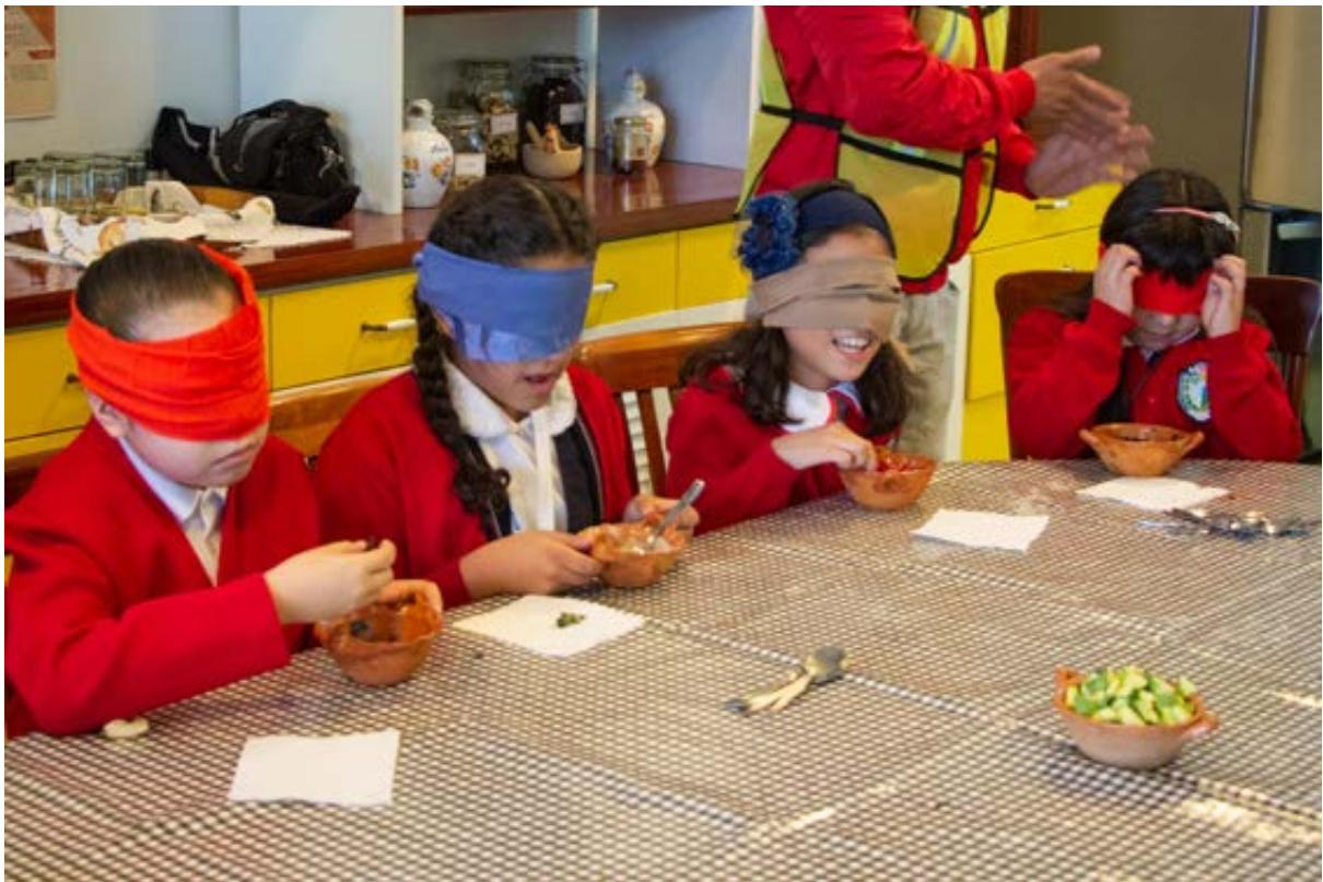
Taller de nutrición con ingredientes mexicanos, para alumnos de la Escuela Primaria República de Cuba.

En vinculación con las escuelas públicas del barrio, se inició el Taller de nutrición con ingredientes mexicanos con alumnos de la escuela República de Cuba, en donde a través de diversos ejercicios sensoriales los participantes conocieron ingredientes locales y de temporada para preparar recetas nutritivas.