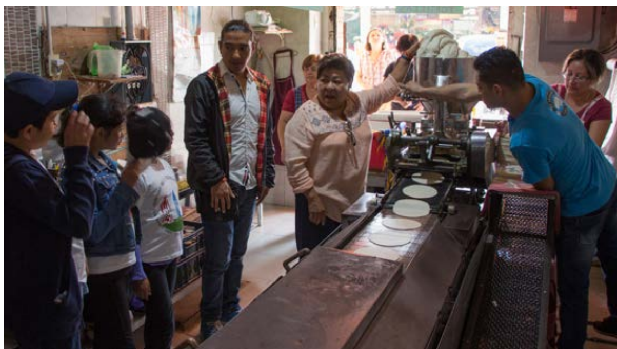
Participantes del curso de verano Vacaciones en la milpa , visitando un molino en el barrio para conocer el proceso de nixtamalización del maíz.

Durante el verano se realizaron las últimas actividades didácticas antes de la conclusión del periodo de exhibición de Maíces, biodiversidad y cultura. Una aproximación desde su consumo cotidiano en el Museo de Geología. En total asistieron 8,400 visitantes durante los horarios regulares del museo y más de 600 vecinos y grupos de escuelas de la zona desarrollaron actividades colectivas de reflexión crítica sobre el tema.