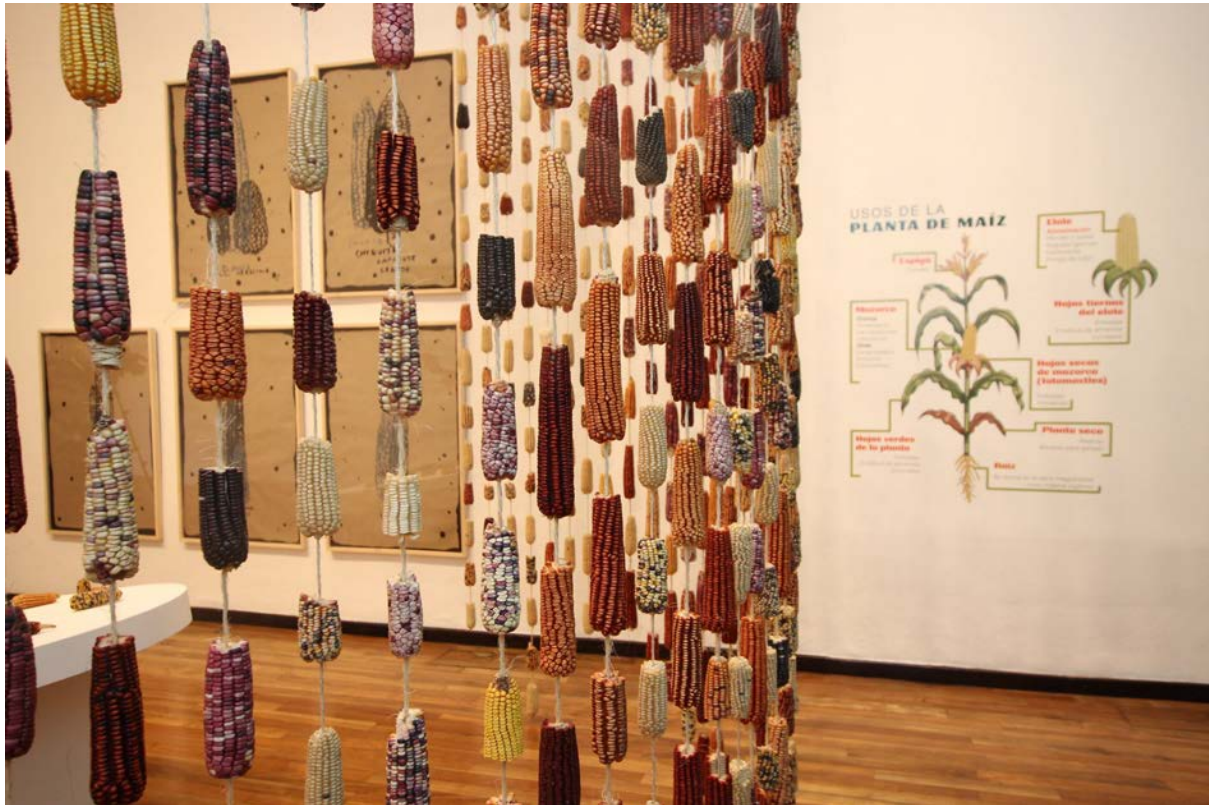
Exposición Maíces, biodiversidad y cultura. Una aproximación desde su consumo cotidiano en el Museo Cabañas, Guadalajara.

El cierre del verano de 2019 en Casa Gallina estuvo marcado por continuar con el trabajo de los primeros meses del año e invitar a diversas reflexiones críticas sobre el maíz y su consumo. Dentro de este marco se implementaron programas educativos y de intercambio de saberes sobre medio ambiente, nutrición y resiliencia que acercaron a la población de Santa María la Ribera a una visión crítica en torno a la producción y consumo de esta semilla.