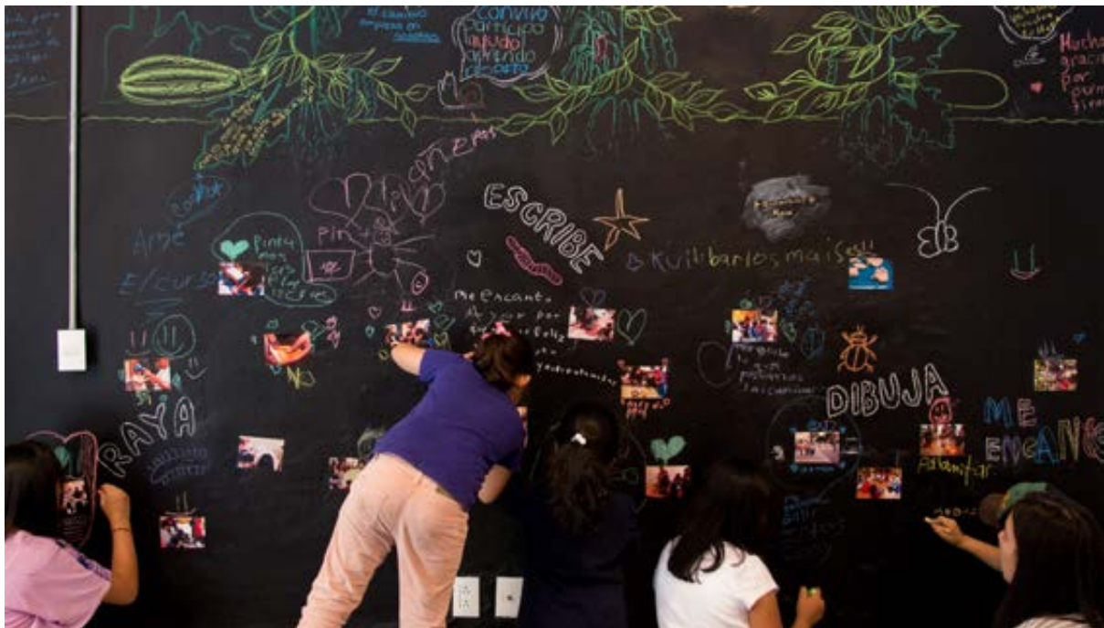
Wall for neighbors to share their experiences in Casa Gallina's workshops.

En este periodo el equipo de Casa Gallina terminó de trabajar en el nuevo sitio web: www.casagallina.org.mx , ya disponible para la consulta de las estrategias y programación de la casa. Como medio de comunicación de la actividad diaria del proyecto contamos con el perfil de Facebook Casa Gallina , plataforma ahora abierta para todos los interesados, pues reservamos las convocatorias vecinales a un grupo cerrado de reciente creación.