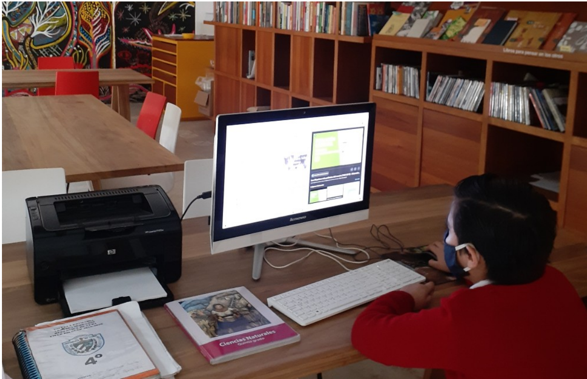
Vecino realizando clase virtual desde Casa Gallina.

A pesar de que Casa Gallina no ha podido abrir sus puertas completamente, mantiene activos dos programas de servicio a la comunidad. Uno es la Prestaduría vecinal , servicio de préstamo de herramientas para los vecinos de Santa María la Ribera. El otro está orientado a los niñas y niños de escuelas públicas del barrio, a quienes se les da acceso al uso de computadora, impresora e internet para, o bien tomar sus clases en línea, o bien hacer tareas.