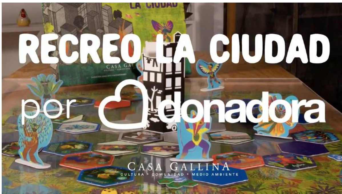
Still del video promocional de la campaña Recreo la ciudad en Donadora.

En febrero culminó la primera campaña de fondeo colectivo realizada por Casa Gallina a través de la plataforma Donadora. Tuvo como finalidad que el juego Recreo la ciudad pudiera distribuirse a mínimo 50 escuelas públicas, localizadas en comunidades de varios estados de la República (Guerrero, Campeche, Oaxaca y Ciudad de México), e implementar un programa de medio ambiente para educadores.