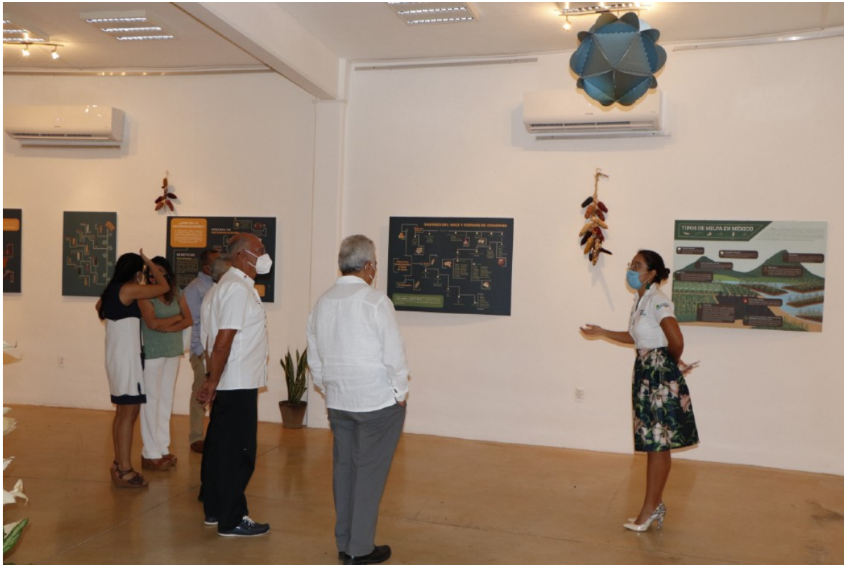
Exhibición Maíces, milpa y biodiversidad en México en el planetario de Cancún Ka'Yok'.