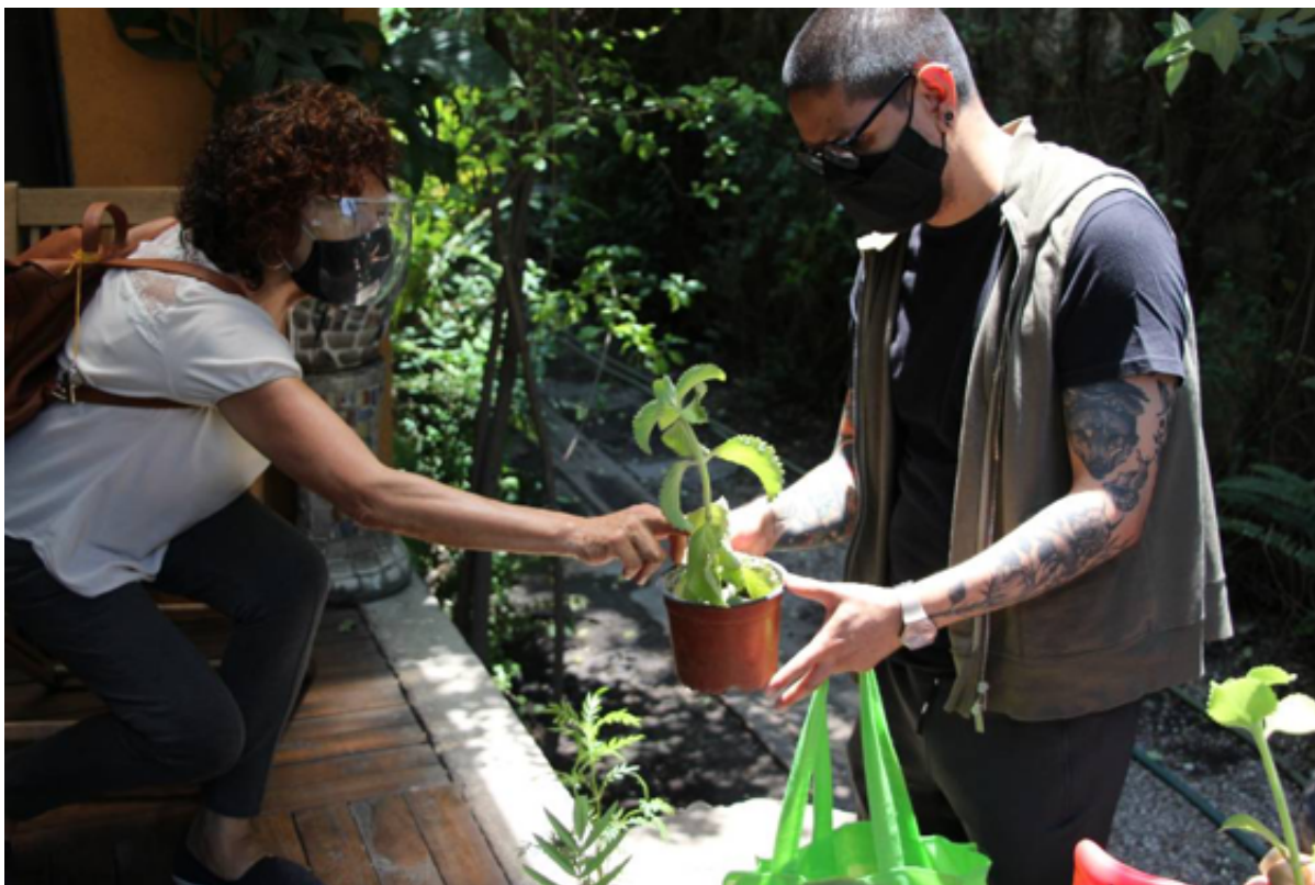
Intercambio de plantas entre los vecinos integrantes de proyecto Guardianes de semillas .